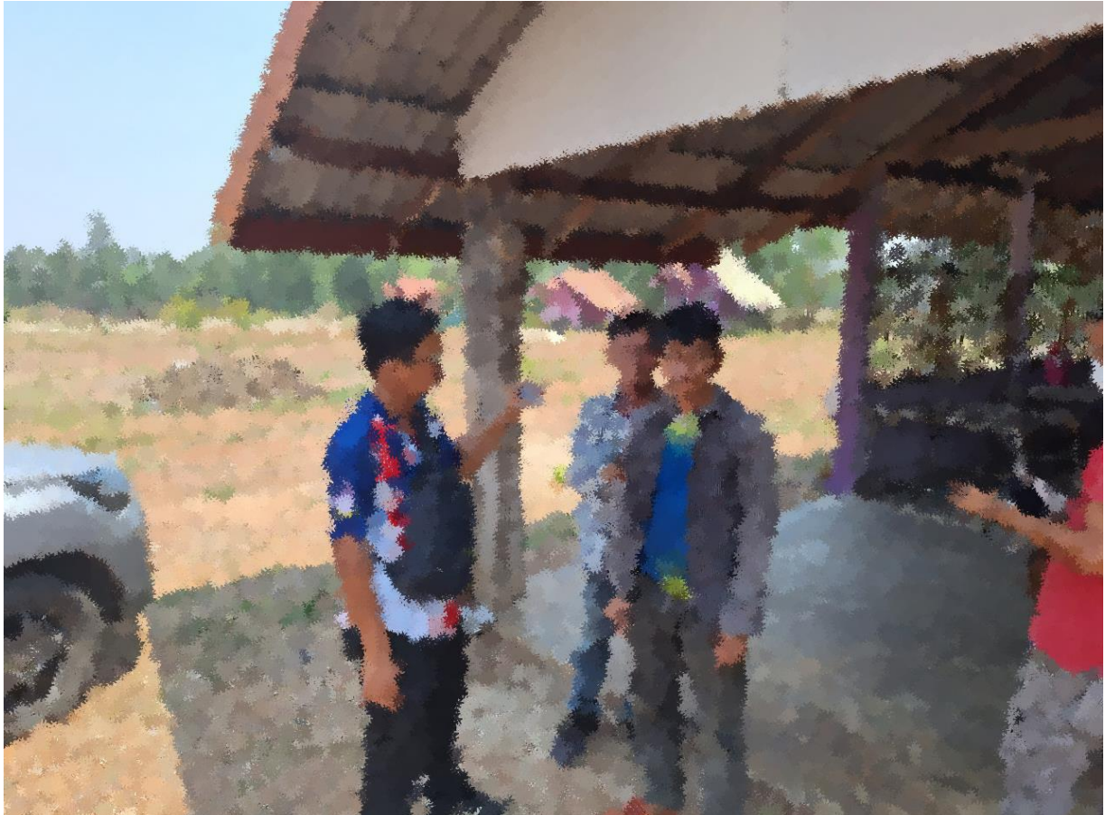
ภาพถ่ายผลการจับกุมผู้ต้องหาประจำวันที 20 ธ.ค.2566

โดยกล่าวหาว่า เสพยาเสพติดให้โทษประเภท 1 (เมทแอมเฟตามีน/ยาบ้า) โดยผิดกฎหมาย และ ลักลอบเล่นการพนัน (สล็อตออนไลน์) ผ่านโทรศัพท์มือถือที่พบนั่นเอาทรัพย์สินกัน โดยผิดกฎหมาย