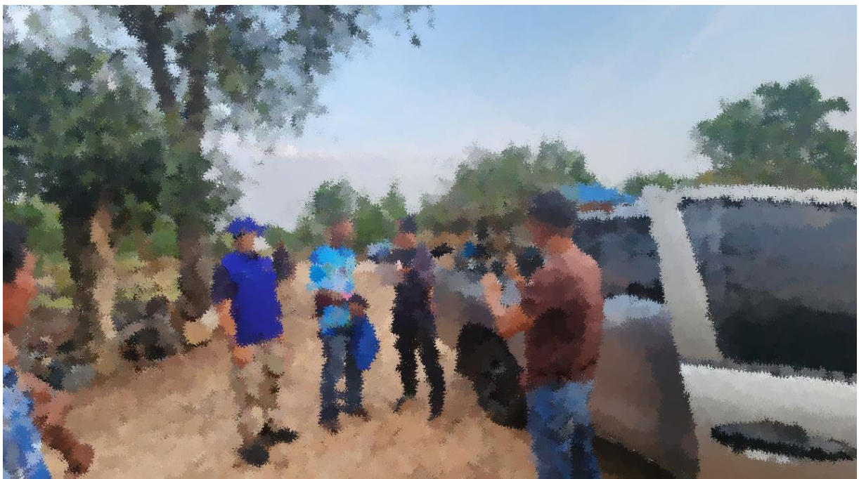
ภาพถ่ายผลการจับกุมผู้ต้องหาประจำวันที่ 1 ธ.ค.2566

โดยกล่าวหาว่า จำหน่ายยาเสพติดให้โทษประเภท 1 (เมทแอมเฟตามีน/ยาบ้า) โดยการมีไว้เพื่อจำหน่าย โดยผิดกฎหมาย และ เสพยาเสพติดให้โทษประเภท 1 (เมทแอมเฟตามีน/ยาบ้า) โดยผิดกฎหมาย และมีอาวุธปืนและเครื่องกระสุนปืนไว้ในครอบครองโดยไม่ได้รับอนุญาตจากนายทะเบียน