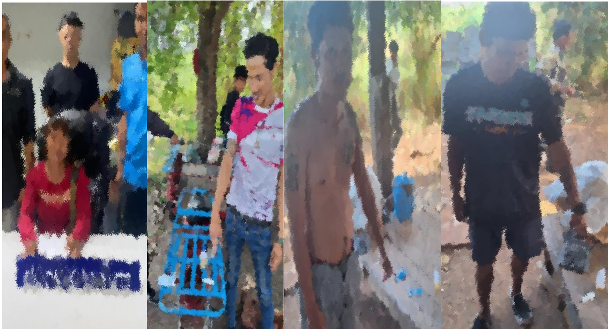
ภาพถ่ายผลการจับกุมผู้ต้องหาประจำวันที่ 10 พ.ย.2566

โดยกล่าวหาว่า “เสพยาเสพติดให้โทษประเภท 1 (ยาบ้า) โดยผิดกฎหมาย”