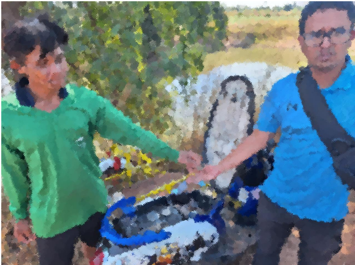
ภาพถ่ายผลการจับกุมผู้ต้องหาประจำวันที่ 14 พ.ย.2566

พร้อมด้วยของกลาง อาวุธปืนยาวประกอบเองจากท่อ พีวีซี ใช้สารไวไฟแอลกอฮอล์ เป็นตัวจุดระเบิด วางพียงกับผนังหน้าบ้าน ใกล้กับตรงที่ผู้ถูกจับยืนอยู่ และกระสุน(ลูกแก้ว) จำนวน 3 ลูกห่อกระดาษของบุรี โดยกล่าวหาว่า มีอาวุธปืนและเครื่องกระสุนปืนไว้ในครอบครองโดยไม่ได้รับอนุญาต และ ลักลอบเล่นการพนัน (สล็อตออนไลน์) ผ่านโทรศัพท์มือถือ พนันเอาทรัพย์สินกันโดยผิดกฎหมาย และ เสพยาเสพติด ให้โทษประเภท 1 (เมทแอมเฟตามีน) โดยผิดกฎหมาย