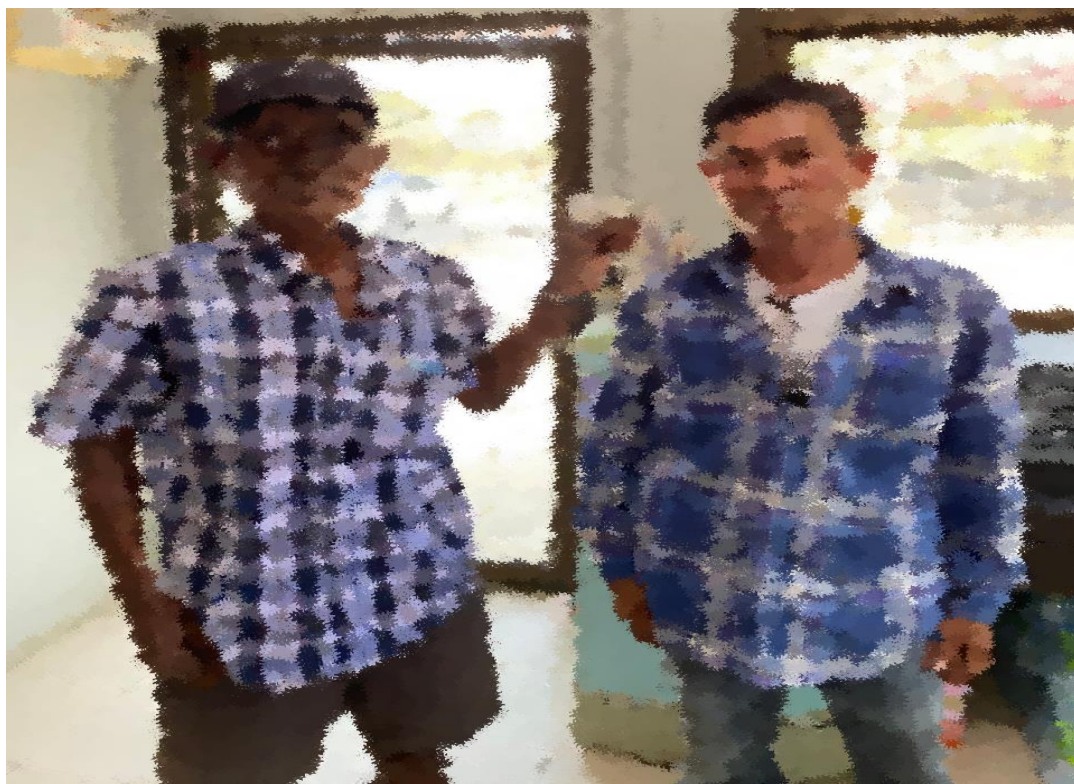
ภาพถ่ายผลการจับกุมผู้ต้องหาประจำวันี่ 2 พ.ย.2566

โดยกล่าวหาว่า มียาเสพติดให้โทษประเภท 1 (เมทแอมเฟตามีนหรือยาบ้า) ไว้ในครอบครองเพื่อเสพ โดย ผิดกฎหมาย และ เสพยาเสพติดให้โทษประเภท 1 (เมทแอมเฟตามีน) โดยผิดกฎหมาย